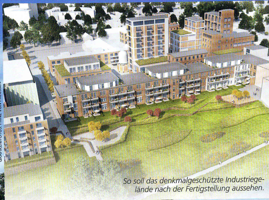
So soll das denkmalgeschützte Industriegelände nach der Fertigstellung aussehen.

Mit den Main Riverside Lofts hat die Prinz von Preussen Grundbesitz AG im letzten Jahr ein geschichtsträchtiges und in der ganzen Region einmaliges, denkmalgeschütztes Industriegebäude mit einem großen Gelände direkt am Ufer des Mains erworben. Das Wahrzeichen der Hattersheimer Stadtgeschichte im Ortsteil Okriftel wird von dem Bonner Projektplanungsunternehmen sorgsam und mit sehr viel Feingefühl für die Erhaltung der historischen Gebäudesubstanz in ein liebenswertes Wohnquartier umgestaltet. „Wir sind uns der großen Aufgabe bewusst, die sich darauf konzentriert, die architektonische Schönheit mit den klaren Strukturen und der allgegenwärtigen Geschichte zu erhalten und in ein einzigartiges Wohnensemble zu integrieren“, erklärt Theodor J. Tantzen, Vorstandsmitglied der Prinz von Preussen Grundbesitz AG.