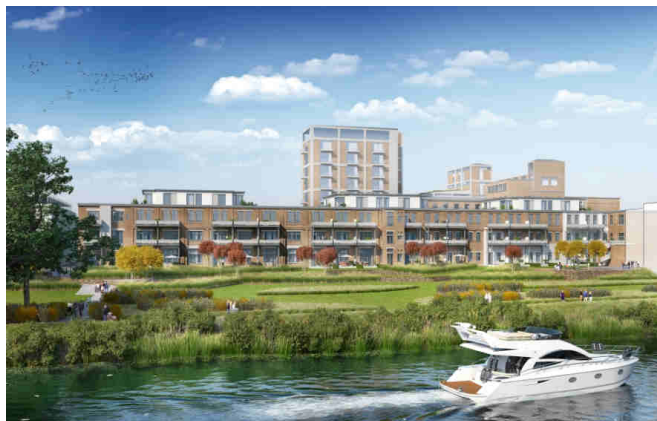
Bildunterschrift: Planung der MAIN RIVERSIDE LOFTS.